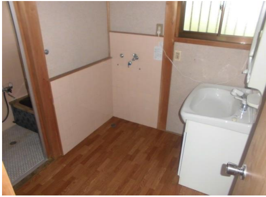
脱衣所(洗濯機置き場)