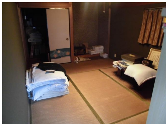
2 F 6和