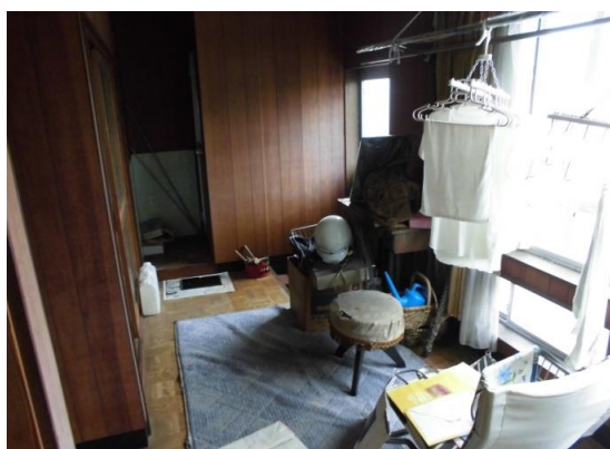
2 F サンプルーム