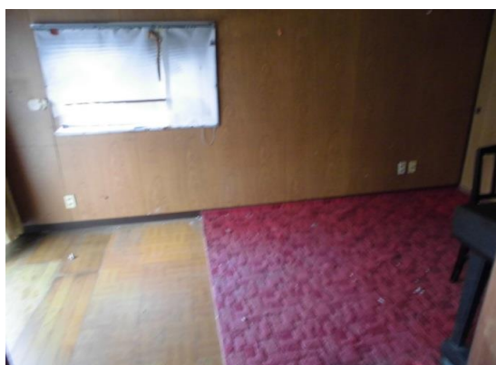
1 F 7.5洋